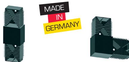
TERRASYS Längsverbinder System 40/60