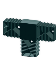
TERRASYS T-Verbinder System 40/60